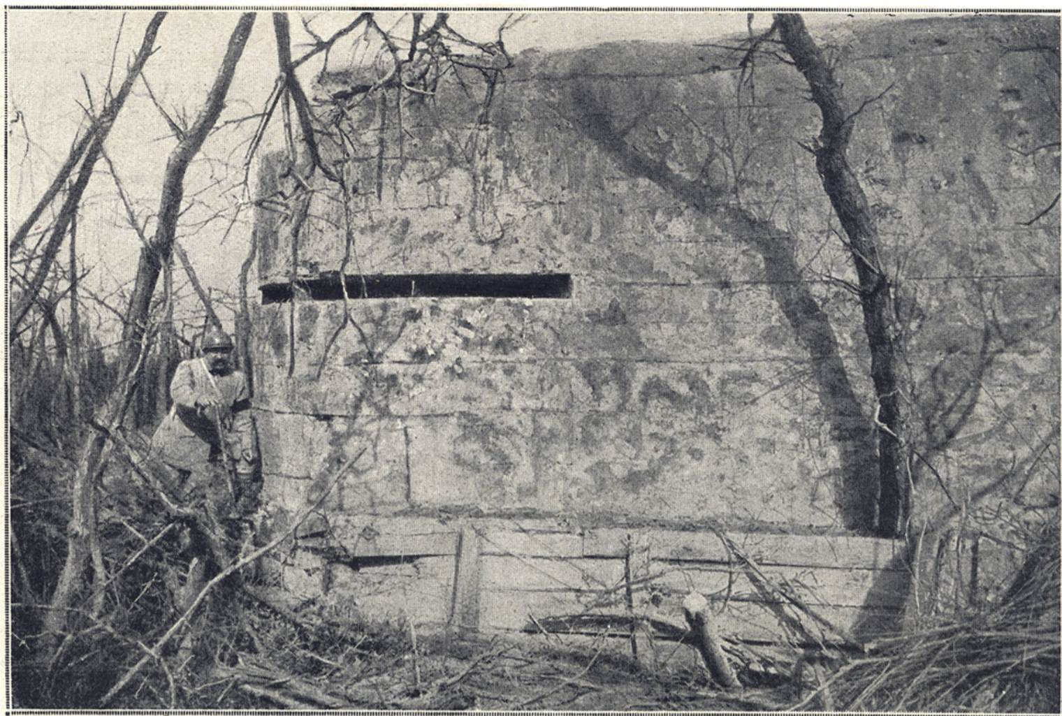
Abri moderne allemand en béton armé avec créneau de mitrailleuse à grand champ horizontal. (Bois des Baguettes, au N.-E. de la Maison du Passeur.)

L'attaque sera reprise le 16 août par l'armée française qui atteindra encore tous ses objectifs; et, le 9 octobre, une avance soudaine de nos troupes accompagnera la progression continue des armées britanniques.